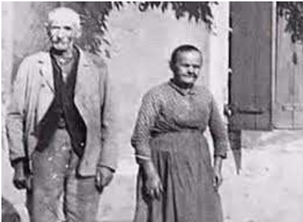
Ouders van Marthe

Marthe Robin (1902-1981) is een van de grote spirituele Franse voorbeelden van de twintigste eeuw. Dit boerenmeisje, dat al sinds haar jeugd door ziekte werd getroffen, heeft meer dan 100.000 mensen ontvangen aan haar ziekbed. Meer dan vijftig jaar heeft ze verlamd gelegen in haar kamertje en toch heeft zij, ook meer dan dertig jaar na haar dood, een internationale uitstraling.