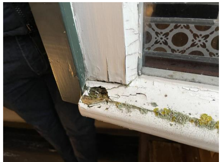
Aangetast hout/ alg en mos aangroei